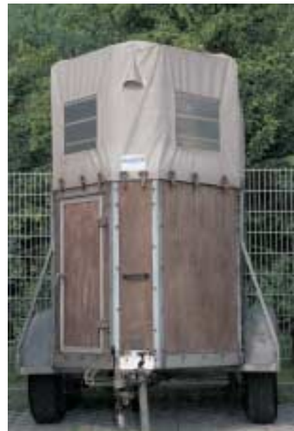
Auch ein alter Holz-Plane-Hänger kann wieder aufgepeppt werden – vorausgesetzt, die Basis stimmt. Genau checken!

Holzhänger aufgefrischt - Die mit Phenolholz beschichteten Siebdruckplatten verbleichen mit der Zeit. Klarlacke sind hier nicht zu empfehlen, da Sie durch das Arbeiten des Holzes schnell abplatzen. Holzhänger können mit einem Holzhänger-Pflegemittel, einer Möbelpolitur oder einer atmungsaktiven Holzschutzlasur behandelt werden. Waschen Sie den Hänger dafür gründlich mit dem Hochdruckreiniger, heißem Wasser und Shampoo. Ist er getrocknet, tragen Sie das Pflegemittel gleichmäßig mit einem Lappen auf. Die Anwen-