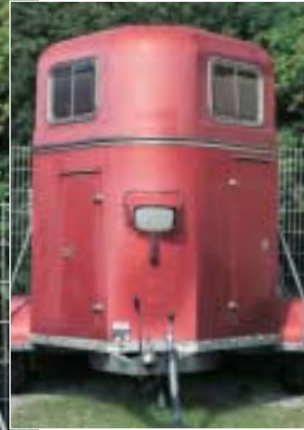
Vorher (r.) – nachher (l.): Mit der richtigen Politur oder einer neuen Lackierung kann man farbige Polyhänger wieder auf Hochglanz bringen.

Polyester – wie neu - Weiße Polyhänger kann man mit Schleifpaste wieder auf Hochglanz bringen: Reinigen Sie Ihren Hänger gründlich mit einem Hochdruckreiniger mit heißem Wasser und Shampoo (Waschanlagen), bis er dreck- und fettfrei ist. Behandeln Sie den getrockneten Hänger dann mit Schleifpaste und waschen Sie ihn nochmals. Anschließend sollten Sie