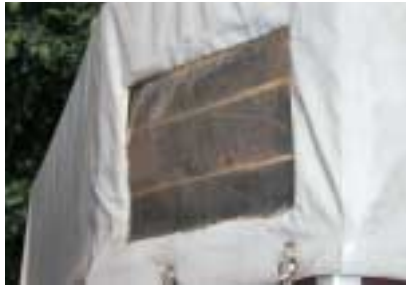
Vorsicht: Risse im Polyester an der vorderen Ausstiegstür (o.), poröse Fensterplanen (u.)

nenntenkleber, da Stolpern und Ausrutschen der Pferde auf lose verlegten Matten gefährlich sein kann. Außerdem kann immer Feuchtigkeit unter die Matte kriechen und den Holzboden mit der Zeit zum Verrotten bringen.